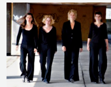
Elb'an Flutes Hamburg